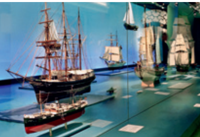
L.u.f.: © Altonaer Museum