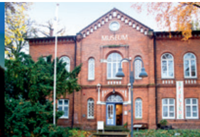
L.u.f.: © Stadtmuseum Pinneberg